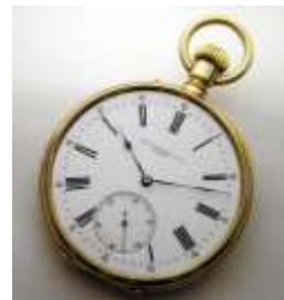
Часы Швейцарского пр-ва