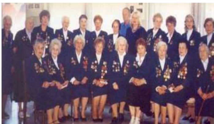
Участницы хора «Фронтовые подруги»

Музей «Фронтовые подруги» - Курский городской клуб, объединяющий женщин-участников Великой Отечественной. Музей был открыт в СОШ № 55 им. Александра Невского в 1996 году. Материалы музея повествуют о женщинах-ветеранах, их роли на войне, героизме и мужестве в борьбе за Великую Победу. Главное отличие этого музея от других в том, что он посвящён людям живым, полным воспоминаний, людям, которые могут поведать о женской доле на войне гораздо больше, чем документы. Женщины не только обеспечивали Красную армию надёжным тылом, но и сумели создать хор «Фронтовые подруги». Он образовался в 1985 году и состоял первоначально из 16 человек, позднее превратился в многоголосый коллектив. Хор получил заслуженно народное признание и симпатии слушателей.