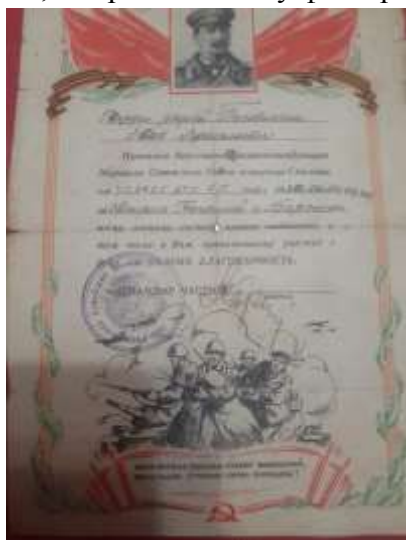
Благодарность Верховного Главнокомандующего