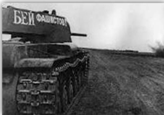
«Автограф» – для победы

В освобождении Киева 6 ноября 1943 года принимал участие уже упоминавшийся нами 48-й отдельный гвардейский танковый полк. В Курской битве отличились два гвардейских полка прорыва в составе 5-й танковой армии-15-й и 36-й. По окончании битвы полки переформированы. 15-й укомплектован уже советскими КВ-1С. Оба переброшены под Ленинград. Там же дрались с фашистами 49-й и 36-й полки прорыва. Дрались до самого освобождения города. 50-й полк прорыва был в составе Волховского фронта. 82-й отдельный полк участвовал в освобождении не только Ленинграда, но и Таллина и даже Моонзундских островов. 21-й отдельный гвардейский полк прорыва первым ворвался в Выборг.