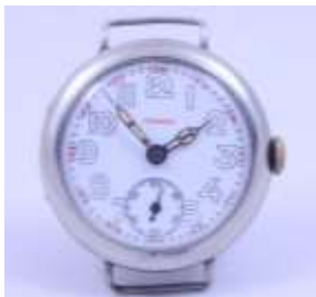
Часы советского производства 1930 годов Гострест Точмех

взевшейся в корпус запекшейся крови солдата, который, возможно, был ранен, а, может, убит. Рядом с этим интересным экспонатом, был найден ключ, по конфигурации которого мы с уверенностью можем сказать, что он от городской квартиры, судьба солдата и часов сейчас устанавливается нашими поисковиками. Но мы можем предположить, что хозяин этих часов был достаточно отважным и мужественным человеком. Часы на полочке в музее имеют сложную судьбу и еще много загадок.