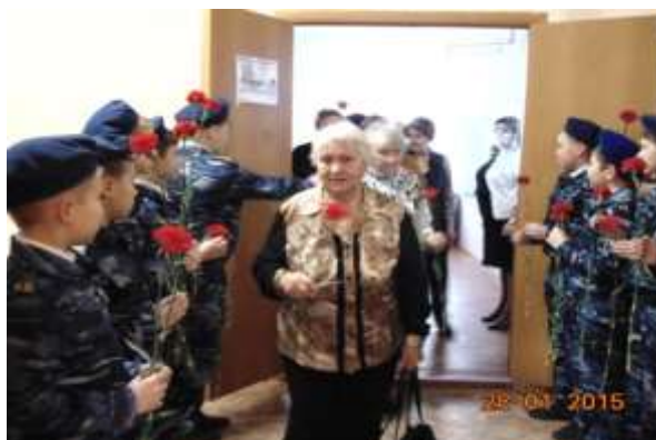
Школьный музей «Блокадное братство»